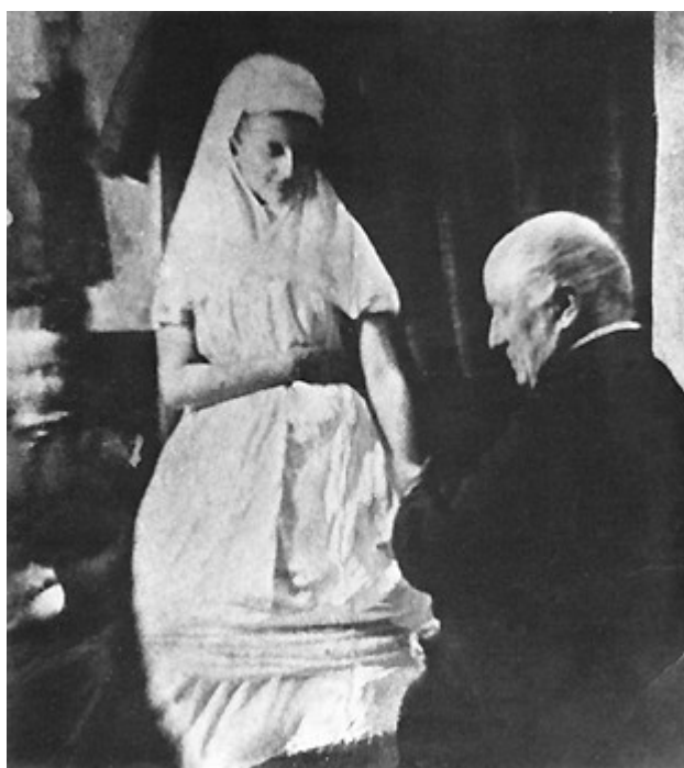
Figura 3: Fotografia com auxílio da luz elétrica de Crookes com o espírito de Kátie King, produzida em 20/07/1874. ( http://www.survivalafterdeath.org.uk/.../crookes/3htm ) 21/04/2009;15:00h

A biblioteca de sua casa teria servido de câmara escura. Os amigos presentes ficaram sentados no laboratório, em frente à cortina, e as câmaras escuras ficaram colocadas um pouco atrás deles, prontas a fotografar o espírito de Kátie quando ele saísse, e a tomar o interior do gabinete todas as vezes que a cortina fosse levantada para esse fim. Cada noite havia cerca de 3 ou 4 exposições de placas nas 5 câmaras escuras, o que forneceu pelo menos 15 provas por sessão. Algumas se estragaram no desenvolvimento, outras ao regular a luz: apesar de tudo, Crookes relatou ter conseguido 44 negativos, alguns medíocres, alguns nem bons nem maus e outros excelentes (Figura 3).